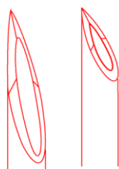
Long bevel Short bevel